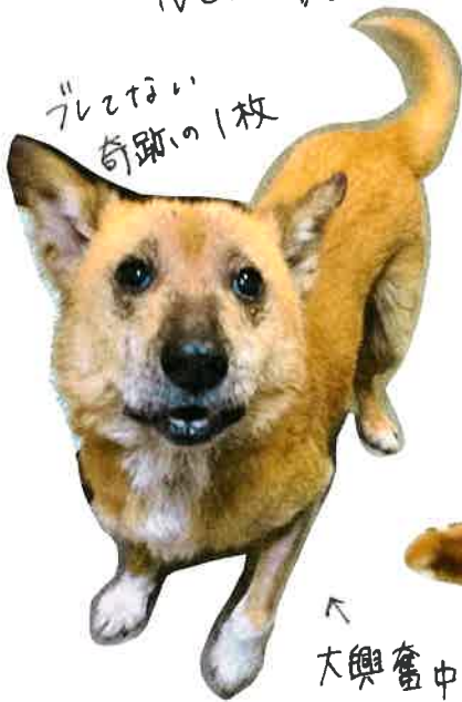
フリスビー 奇跡の1枚

おいらは保護犬 ムク！ リーデカネの 看板犬だ。 ボール遊びとオヤリ 大好きだ！ チャームポイントは この困り顔。 可愛いだろ〜？ スタッフはみんなおいらは ×ロ×ロなんだ〜